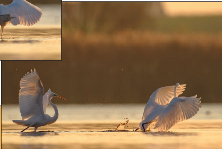
W końcu jedna z nich dała za wygraną i uciekła z udeptanej ziemi czy może raczej wzburzonej wody.