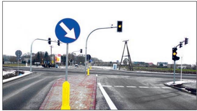
Więckowica - zmodernizowane skrzyżowanie ul. Bukowskiej z ul. Gromadzką, styczeń 2019