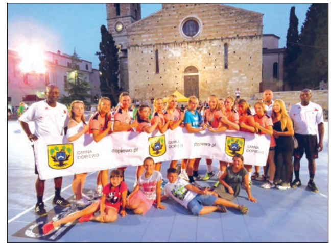
UKS Pantery Dopiewo