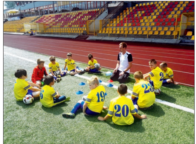
Gminny Klub Sportowy Dopiewo