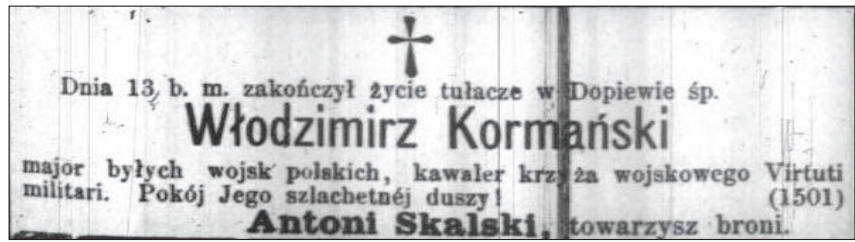
Nekrolog W. Kormańskiego – Dziennik Poznański nr 64 z 1876 r.

szwadronu na Nowym Mieście w Warszawie). Po klęsce powstania, odznaczony złotym krzyżem, udał się na emigrację do Francji, gdzie w 1832 r. przebywał w Awinionie, następnie w Aurillac, a w 1834 r. w Paryżu. Brał udział w wypadkach Wiosny Ludów w 1848 r. W następnych latach przebywał w Strasburgu (wraz ze swoim kolegą Florianem Skrzetuskim), gdzie zaskoczyła ich wojna francusko-pruska (1870 r.) w Wissemburgu i Offenburgu. W 1872 r. została zebrana składka za pośrednictwem „Kuriera Poznańskiego”, za którą mógł przybyć do