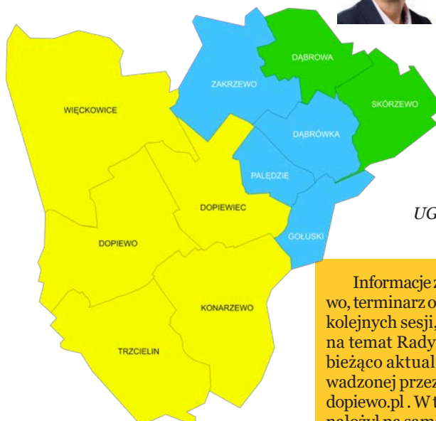
Okręg I Okręg II Okręg III