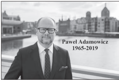
Paweł Adamowicz 1965-2019

Chciałoby się cofnąć czas, zatrzymać zamachowca, gdy przemieszczał się w kierunku sceny, wytrącić z jego ręki nóż, zanim zadał śmiertelne ciosy. Chciałoby się, ale to niemożliwe. Stało się, co się stało. Z sukcesem zrealizował swój plan, gdy wszyscy wysyłali „Światelko do Nieba” podczas 27 Finału Wielkiej Orkiestry Świątecznej Pomocy. Kto mógł się spodziewać, że to, co dla większości jest momentem radości, komuś stwarza szansę na urzeczywistnienie niezrozumiałego i okrutnego planu.