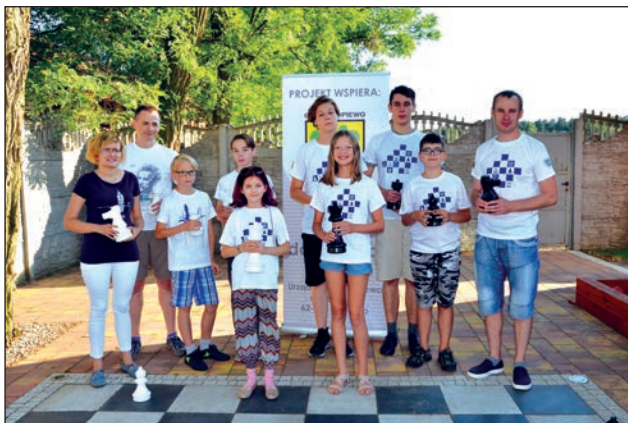
Klub Sportowy Korona Zakrzewo - Sekcja Szachowa