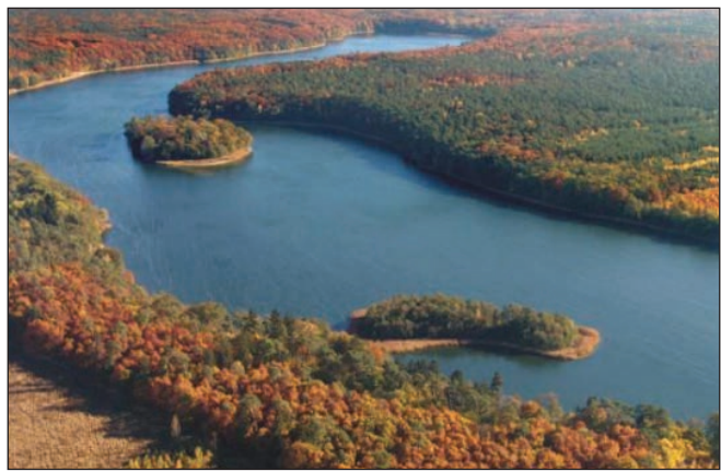
Rynna podlodowcowa z Jeziorem Góreckim