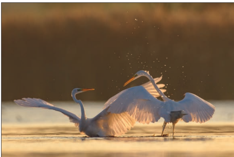
W odwecie druga czapla spróbowała frontального ataku swym ostrym dziobem.