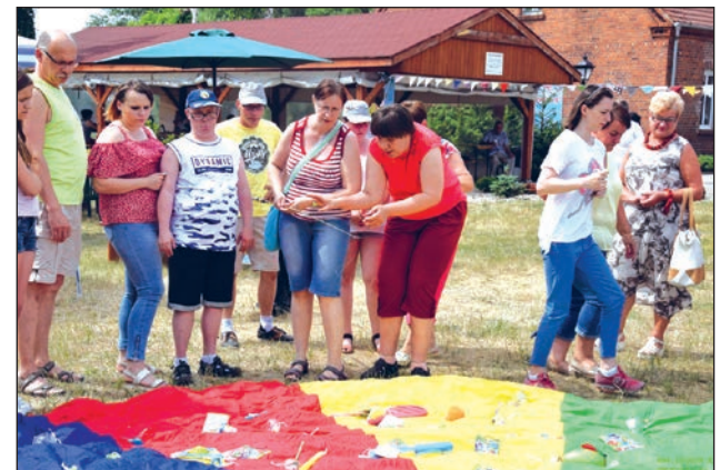
Stowarzyszenie na Rzecz Osób Niepełnosprawnych "Promyk"