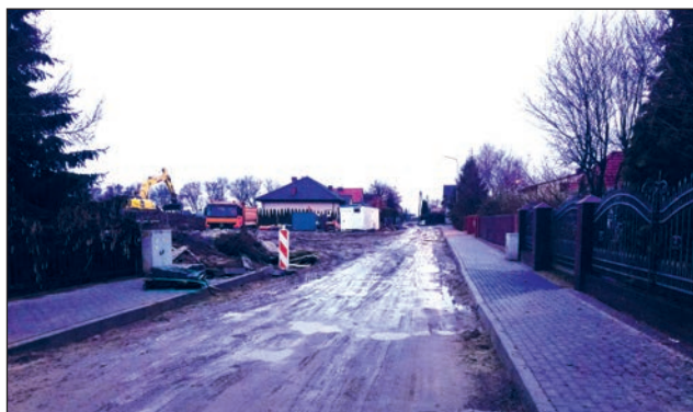
Skórzewo - budowa ul. Czeresińskiej