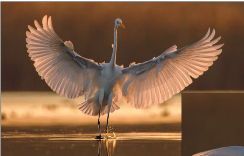
Sprzeczka. Najpierw czaple solidnie nawrzeszczały na siebie nawzajem. Jednocześnie, aby wystraszyć rywala, zrobić wrażenie i pokazać swoje rozmiary rozpostarły szeroko skrzydła.

Spektakularność metamorfozy czapli po rozłożeniu skrzydeł przypomina larwę przemieniającą się w pięknego motyla.