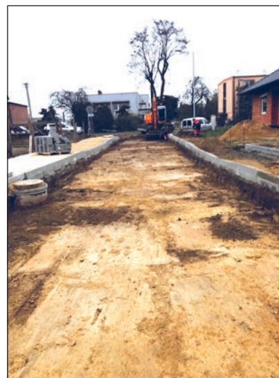
Budowa ul. Sokołów w Dopiewie

skiej od ul. Północnej do ul. Wiśniowej w Dopiewie i miejsca postojowe na ul. Leśnej w Dopiewcu, przebudowaliśmy parking przy ul. Kolejowej w Skórzewie oraz wykonaliśmy miejsca postojowe i chodnik przy CRK Konarzewo. Założyliśmy tereny zielone wraz z ich pielęgnacją oraz prowadziliśmy bieżące utrzymanie zieleni na terenie Gminy Dopiewo. Ponadto na terenie Gminy Dopiewo prowadziliśmy bieżące oraz zimowe utrzymanie dróg i ulic, zbiórkę odpadów gromadzonych w koszach ulicznych i likwidację dzikich wysypisk odpadów oraz ich unieszkodliwianie. W ramach działań zleczanych przez Zarząd Dróg Powiatowych w Poznaniu realizowaliśmy sprzętanie zanieczyszczeń z jezdni dróg powiatowych na terenie Gmin: Dopiewo, Komorniki, Buk i Stęszew.