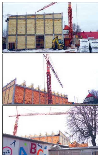
Dąbrowa - rozbudowa Szkoły Podstawowej o salę gimnastyczną i sale lekcyjne