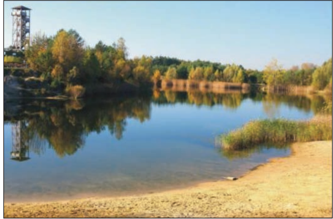
Osowa Góra – morena czołowa, kulminacja Wału Pożegowskiego

od Parku przebył w około 2000 lat. Ostatecznie lodowiec dopłynął do miejsca, w którym dziś znajduje się Leszno, zatem około 45 km na południe od Parku. Tam się zatrzymał. Miało to miejsce 20 000 lat temu. Ponieważ lodowiec pokrył znaczną część kontynentu nazwano go ładolodem skandynawskim. Jego grubość na obszarze Parku wynosiła najprawdopodobniej 500-600 metrów. Oznacza to, że 20 000 lat temu obszar Parku znalazł się pod przykryciem lodu o grubości 5-6 boisk piłkarskich ustawionych w pionie jedno, na drugim. To siedmiokrotnie więcej niż wysokość wieżowca Uniwersytetu Ekonomicznego w Poznaniu – jednego z najwyższych budynków w mieście. Średnia temperatura lipca spadła do 5-7°C (obecnie wynosi 18°C), a średnia temperatura stycznia do przerażających wartości poniżej -20°C (obecnie wynosi -2°C, więc ponad dziesięciokrotnie więcej niż 20 000 lat temu!). Klimat na terenie Parku przypominał zatem warunki panujące obecnie na Antarktydzie lub na Grenlandii. Krajobraz był również podobny – było to królestwo śniegu i lodu. Tymczasem lód rzeźbił, modelował i na swój sposób kształtował swoje podłoże. Pomagały mu w tym jego wody roztopowe – różnej wielkości strumienie, rzeczki i rzeki płynące po jego powierzchni, w jego wnętrzu, a przede wszystkim pod nim. Szczególnie w nieco cieplejszych miesiącach letnich, gdy lód się topił, więc wody nie brakowało. Lodowy rzeźbiarz przystępuje więc do pracy.