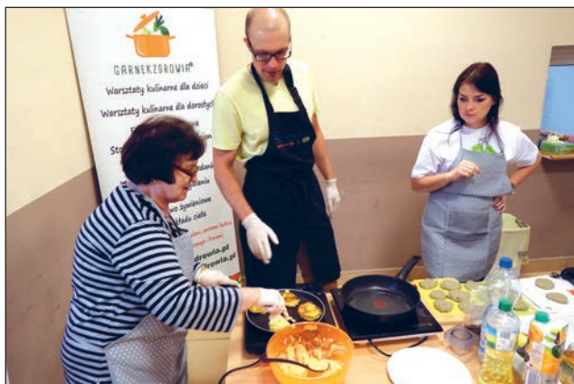
Fundacja "Bez Barier"