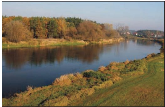
Poznański Przełom Warty

Ponieważ lód jest bardzo ciężki (1m 3 lodu waży blisko tonę), ładolód potrafił wyciskać na powierzchnię terenu zalegające pod nim warstwy różnych utworów, np. piaski, glinę, il. Tak też się stało pomiędzy Mosiną a Dymaczewem Starym, gdzie ładolód, z głębokości kilkudziesięciu metrów, wycisnął na powierzchnię terenu ogromne ilości łu, tworząc w ten sposób wzniesienia Wału Pożegowskiego. Najwyższe z nich to Osowa Góra, wznosząca się 132m n.p.m i bliżej 80m ponad dno przylegającej do niej doliny Warty. Wzniesienia te to formy rzeźby zwane morenami czołowymi – czo-