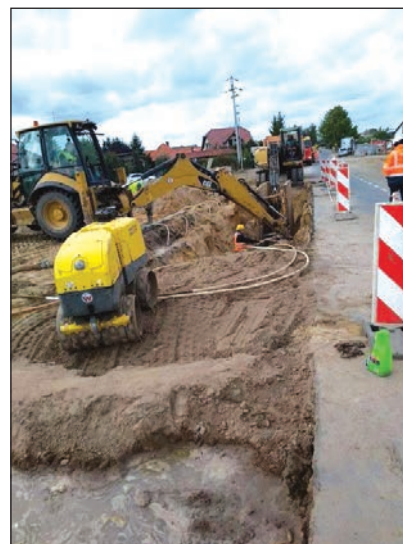
Budowa kanalizacji sanitarnej- Gołuski ul. Dopiewska