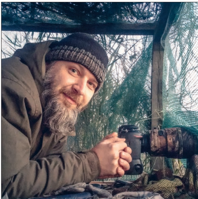
Zza kulis. Tak sobie leże i patrzę na rozgrywające się przed ukryciem rozmaite spektakle przyrodnicze, których skrawki prezentuje Wam w Czasie Dopiewa.