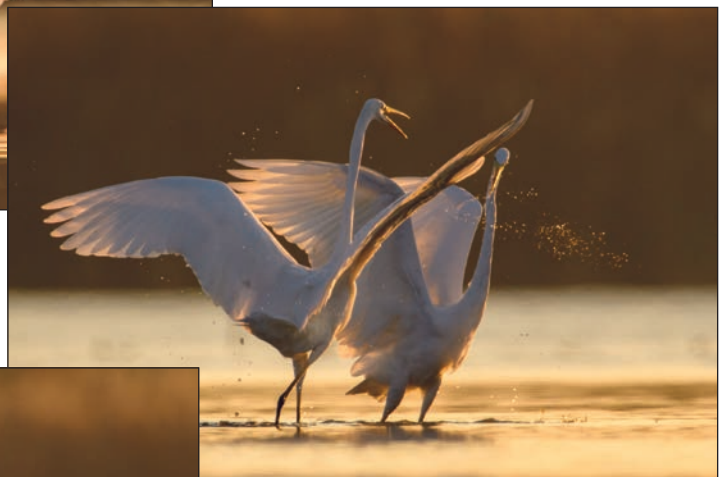
Jedna z czapli, chcąc ustalić swoją dominację, przystąpiła do ataku z powietrza