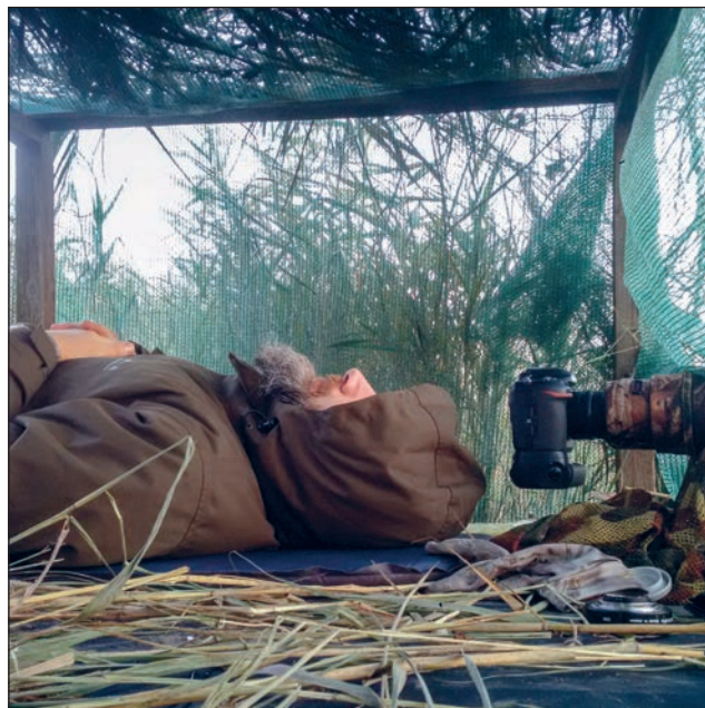
Tak wygląda chwilowa utrata czujności fotografa, który wstał o nieprzychylnie wczesnej porze.