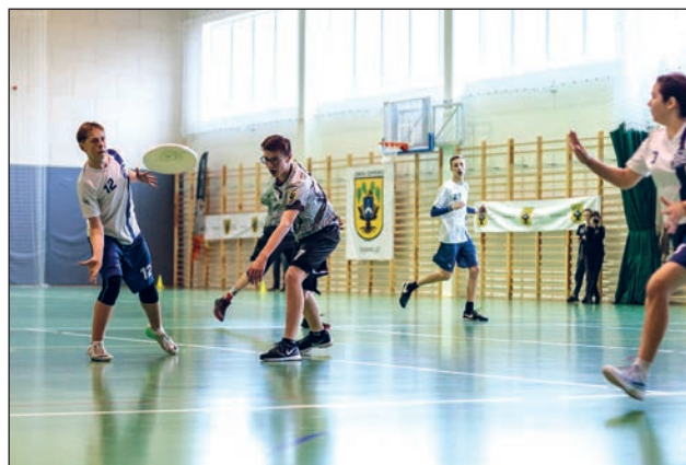
Fundacja "Brave Beavers"