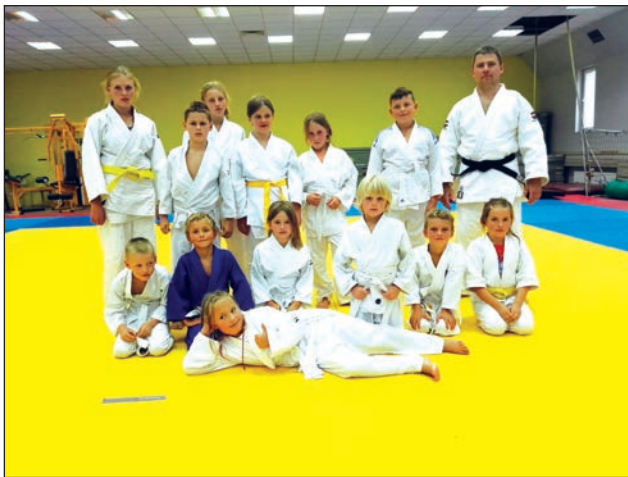
UKS Judo Kano