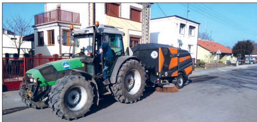
Sprzątanie zanieczyszczeń z jezdni